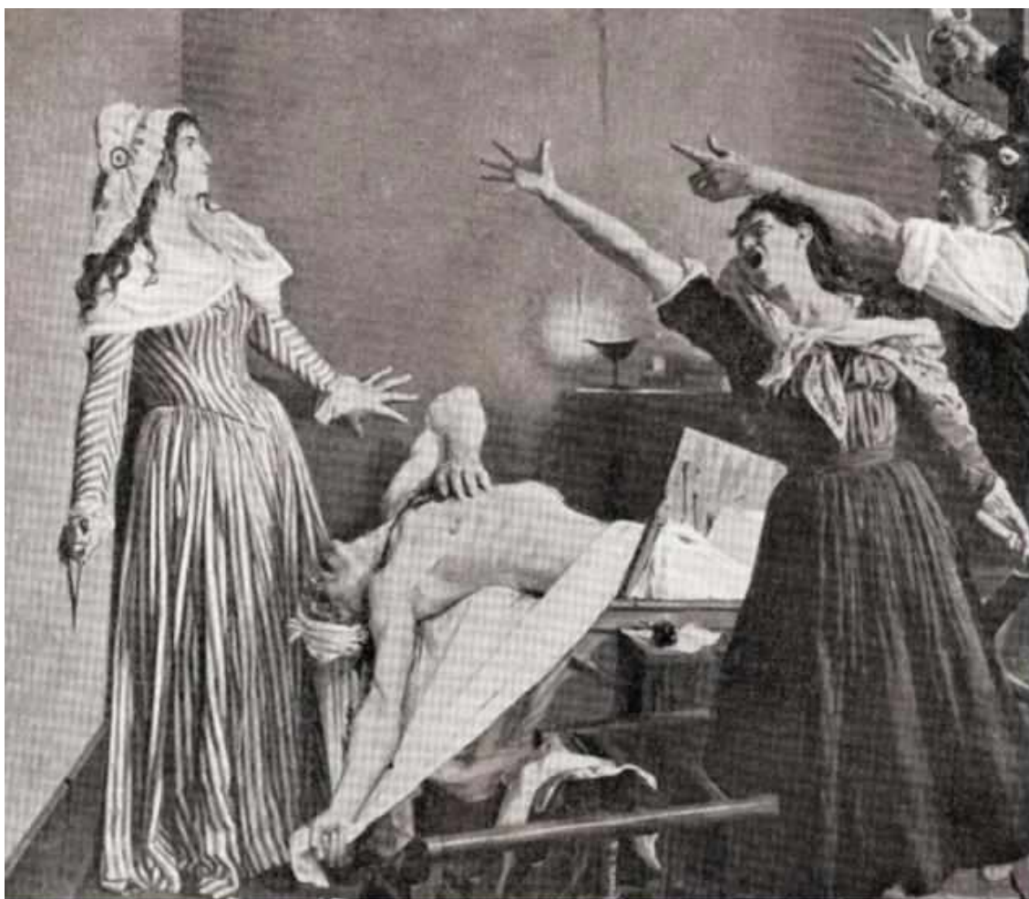
Charlotte Corday (1768-1793) girondar gazteak hil egin zuen Jean Paul Marat, haren ustelkeriagatik. Guillotinatuta egin zuten eta haren izen ona zikindu egin zuten, "marimutil" deituta. Egile ezezaguna.