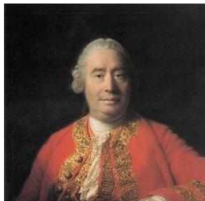
David Hume (1711-1776)ren erretratua, Allan Ramsayk egina.

David Hume (1711-1776) –ilustrazioko filosofo garrantzitsua hura ere– etengabe defendatu zuen emakumeen gaitasun intelektualen berdintasuna, eta haien heziketaren eta ahalduntzearen alde egin zuen. Hume desafiatu egin zituen ohiko genero-estereotipoak. Uste zuen emakumeek gizonen potentzial bera zutela hazkunde intelektualerako eta garapenerako, eta aukera berberak izan behar zituztela hezkuntzan eta jarduera intelektualetan. Of the Standard of Taste saiakeran, Hume adierazi zuen emakumeek gizonen parekoa edo are handiagoa zutela gustu eta iritzi naturala. Argudiatu zuen seriotasunez hartu behar direla emakumeek estetikaz eta gustuaz dituzten iritziak eta ez direla baztertu behar soilik haien generoagatik. Hume emakumeei buruz zituen iritziak oso aurrerakoiak ziren bere garairako, baina merezi du aipatzea hala ere bazituela zenbait aurreiritzi eta estereotipo emakumekiko. Bereziki, haren gutun eta idazki pertsonaletan antz ematen da hori, noizean behin emakume izaerari buruzko orokortzeak egiten baititu.