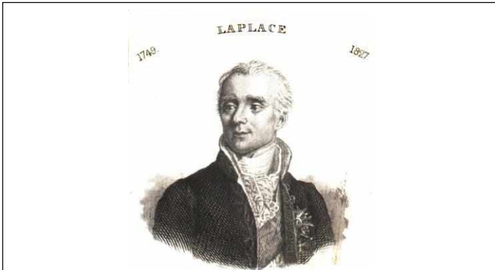
Pierre-Simón Laplace (1749-1827) astronomo, fisikari eta matematikari frantziar bat izan zen. Newtonen jarraitzailea, ekarpen handiak egin zituen landu zituen alor guztietan (aipatzekoa da, matematikan, haren izena daraman ekuazioa).