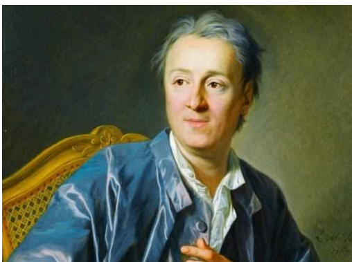
'Denis Diderot-en erretratua'(1767), Louis-Michel van Loo.

Bestalde, ilustrazioko beste pentsalari batzuek emakumeen eskubideen alde eta berdintasun handiagoaren alde egin zuten. Adibidez, Mary Wollstonecraftek, Vindication of the rights of woman (1792) lanean, sutsu defendatu zituen emakumeen heziketa eta eskubide politikoak; eta emakumeak arrazionaltasun handiko eta aukera-berdintasuna merezi duten gizabanako gisa ikusten ditu.