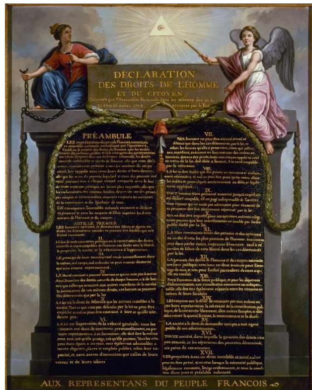
Gizonaren eta herritarraren eskubideen adierazpena (1789).

Hirugarrenik, Giza Eskubide naturalen lehen aldarrikapenak izan ziren. Haien artean, aipagarriak dira Bill of rights (1688), Ingalaterran, Gizonaren eta herritarraren eskubideen adierazpena (1789), Frantzian, eta Konstituzioa (1787), Amerikako Estatu Batuetan. Haien bidez, aldarrikatzen da gizabanakoek jaiotzez eskubide naturalak dituztela eta zuzenbide positiboak (edozein gobernu sortutako legeek) errespetatu egin behar dituela eskubide horiek. Nabarmentzekoa da burgesiak “jabetza eskubidea” ere eskubide naturalen artean kokatu zuela, hura nahitaezko baldintza baitzuen haren existentzia justifikatzeko.