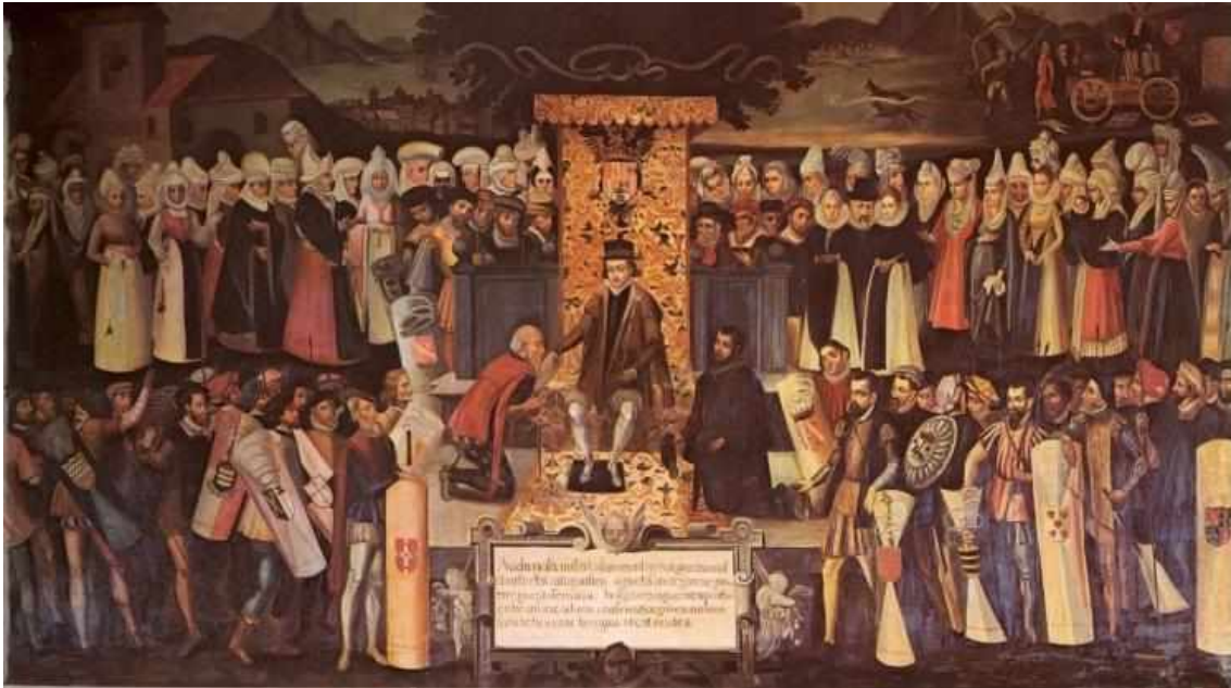
Fernando Katolikoa Bizkaiko Foruen zina egiten, 1476an (Vázquez de Mendieta, 1607, Gernikako Batzar-Etxean)

erregistratu ziren eta lege bihurtu ziren. Euskal lurralde bakoitzean, era batean garatu ziren; baina euskal foruak deitzen zaie denei, orokorrean, haien artean antzekotasun nabarmenak baitaude.