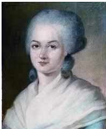
Olympe de Gougesen erretratua. Alexander Kucharsky (1741–1819).

Olympe de Gougesen benetako izena Marie Gouze zen. Montauban herrian jaio zen, 1748ko maiatzaren 7an, burgesia txikiko familia batean. Haren ama izargarbitzaile ( drapier ) baten eta abokatu aberats baten alaba zen; eta aita “ofiziala”, harakina. Hala ere, badirudi Marie Gouzen benetako aita, ala aita “naturala”, Jean-Jacques Lefranc de Pompignan izan zela, Montaubaneko nobleziako figura bat: akademikoa, poeta eta Voltaireren etsai amorratua.