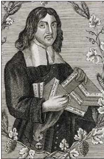
Gerrard Winstanley (1609-1676).

Esandakoaren harian, John Locke (1632-1704) pentsalari liberalaren teoria aipatu beharra dago. Lockeren arabera, Estatuaren boterea mugatu beharra dago, batez ere jabetzaren eskubideari dagokionez, jabetzak bihurtzen baitu, haren iritziz, pertsona burujabea eta beregaina. Hau da, “Jainkoak denoi emandakoa” –ondasunak eta haien gozamina– “naturalki”