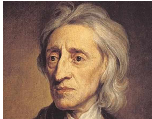
John Locke (1632-1704), Godfrey Kneller-ek eginiko erretratuan. CC BY-SA 4.0. lizentziapean.

Jabetza-eskubidea ez da beti onartu eskubide natural gisa. Izatez, jabetza pribatua eskubide natural gisa ezartzeak eztabaida ugari piztu zituen Ingalaterran, XVI. eta XVII. mendeetan. Izan ere, Akinoko Tomasen garaitik eskubide naturalen jatorria Jainkoa zela kontsideratzen zen. Jatorri jainkotiarrek ematen die eskubide naturalei beharrezko legitimotasuna eta legezotasuna; eta, ondorioz, gizakiek sorturiko legeek, zuzenbide positiboa osatzen dutenek, errespetatu egin behar dituzte eskubide horiek. Baina arazoa da eskubide naturalak