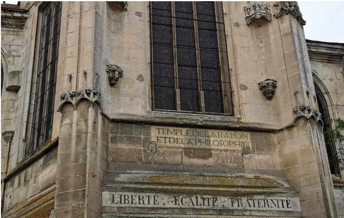
Saint-Martin d'Ivry-la-Bataille eliza.

Deismoa modu honetan definitu daiteke: Jainkoaren existentziaren gaineko sinesmena izatea pentsamendu arrazionalen soilik oinarrituta. Hau da, deistek sinesten dute badela Jainko bat, unibertsoa edo diren guztiak sortu dituena; baina haien Jainkoak ez du esku hartzen munduan, ezta bizitzaren inongo esparrutan ere. Deus otiosus deritzona da: egonean dagoen jainkoa. Haientzat, naturaren bidez jartzen da agerian Jainkoaren existentzia, errebelazioaren beharrik gabe. Laburbilduz, arrazoiaren printzipioekin eta dogmarik gabe eraikitako erlijioa da deismoa.