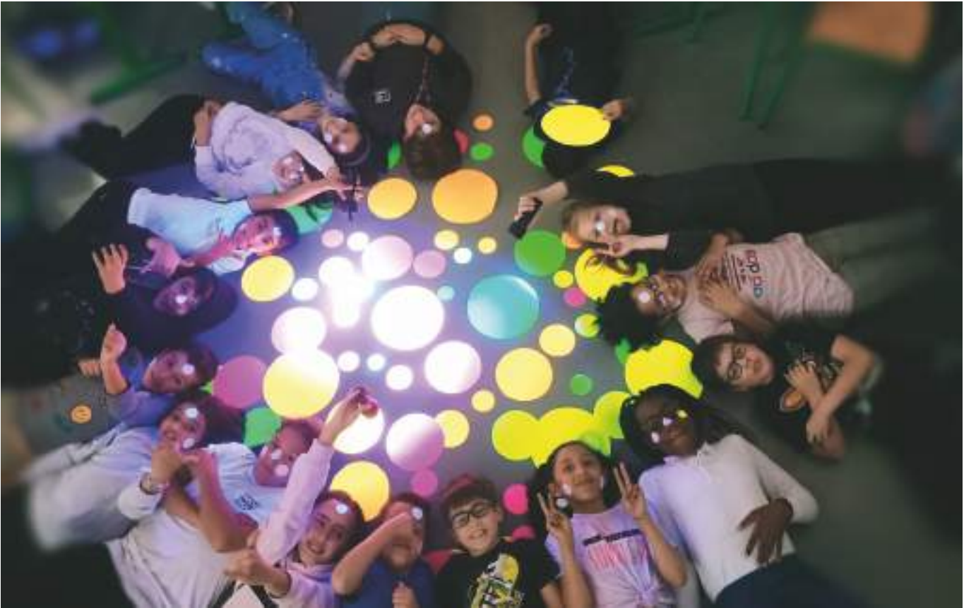
Artium Arte Garaikideko Zentroaren eskutik egin ditu hiru urte Barrutia ikastolak Magnet Erakarri proiektuan.

du artistikoaren potentzialtasuna zabaldu nahi izan dugu, eta aberasgarria izan da. Ikusi ahal izan denez, pentsamendu artistikoa baliagarria da eskolako curriculumara garatzeko”.