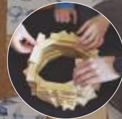
San Fermin ikastola

Irakasleen prestakuntza gogoetatsua, hezkuntza hobetzeko giltza