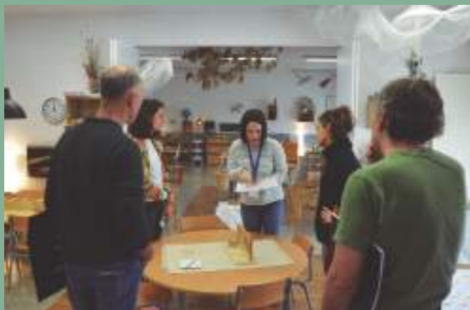
Mendigoiti ikastetxe publikora bisita.