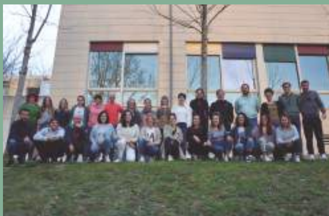
1. promozioiko talde argazkia.