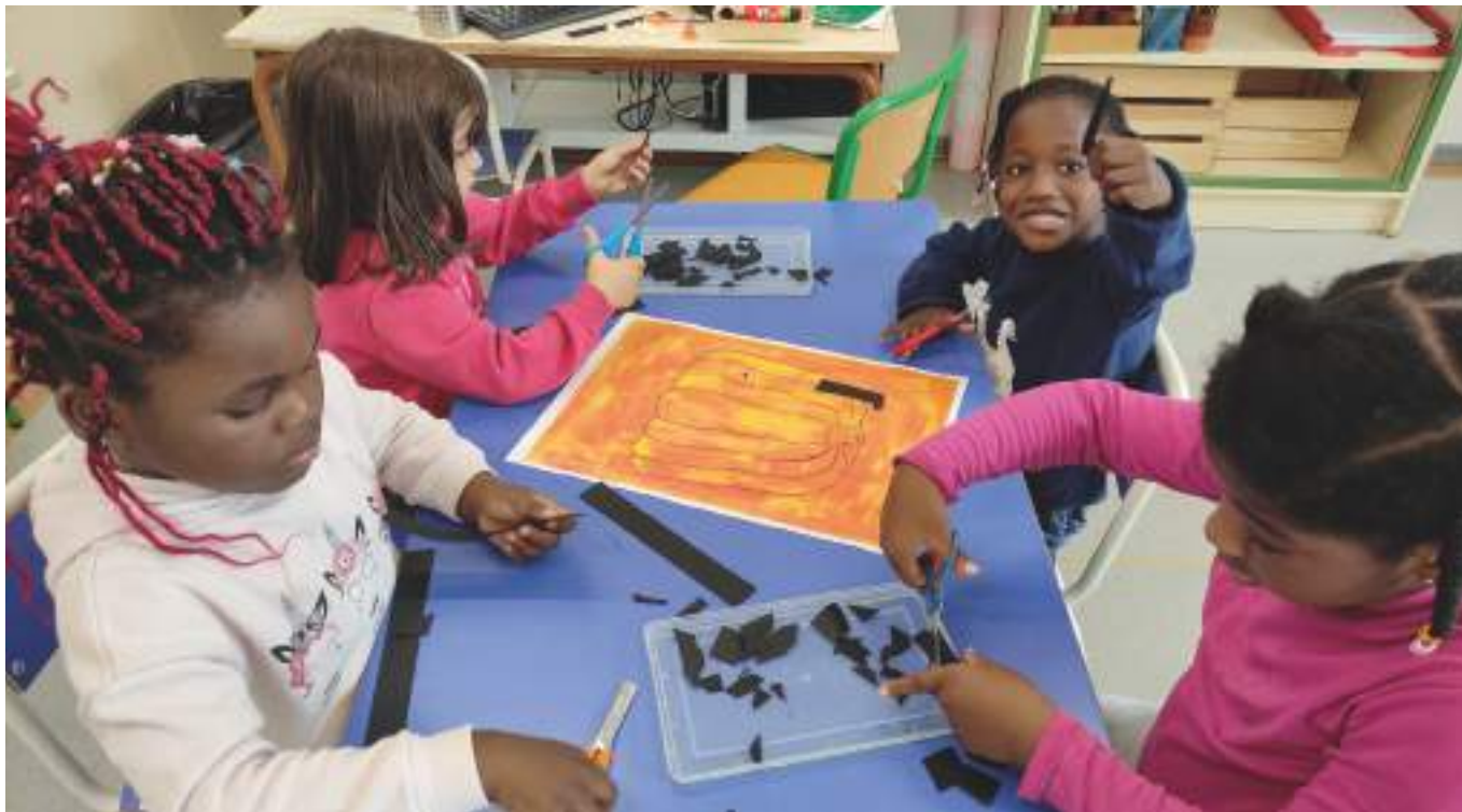
Barrutiako ikasleak Yayoi Kusama artistaren obran inspiraturiko lanak egiten.

Harrotasunaz eta ahalduntzeaz gain, kide eta parte izatearen sentimenduak areagotu dira proiektuari esker, zuzendariaren iritziz: “‘Hau nik egin dut’ esatetik, ‘hau guk egin dugu’ esatera pasatu dira ikasleak. Erronka da, gure publikoa egunero ari delako berritzen, etorkin emari handiko ikastetxea baita Barrutia (gaur egun, 24 nazionalitatetako 356 haur ditu ikasgeletan). Baina, proiektu honekin, ikasle etorri berriak geureganatzea lortu dugu, lehen egunean ez bada bigarrenan. Ikasle guztiei baina, bereziki, ikasle etorri berriei euren lekua aurkitzen lagundu die arteak, haur guztiak ikusten baitute denek ekarpena baliozkoa dela lantegietan. Ona/txarra kontzeptuak alboratu ditugu; horretan hezi ditugu; ekarpen guztiak baliagarriak direla erakutsiz hezi ditugu. Gainera, etorri berriek, ahozko hizkuntzatik harago, gorputzez edo eskulanez adierazi ahal izan dute behar dutena. Horrek ongi sentiaraztea dakar, lekua aurkitzea, eta kide izatearen sentimendua areagotzea”.