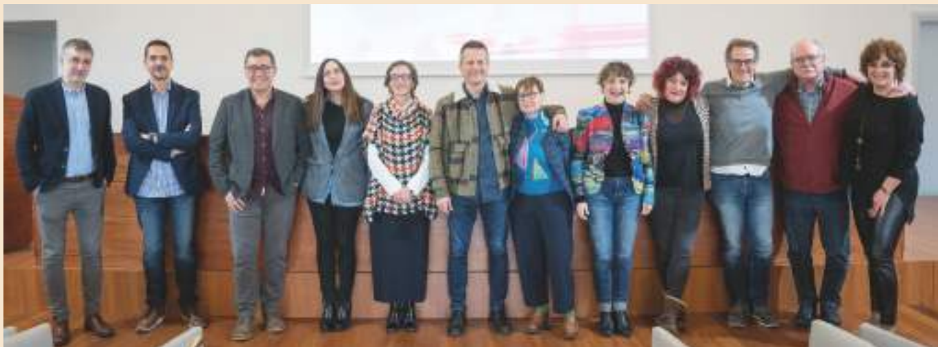
Askotariko segregazioari nola erantzun hezkuntza sistematik? jardunaldiaren antolatzaileak eta parte-hartzaileak.